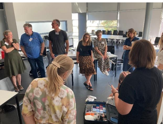
Lyskuffert gennemgås og udleveres

Synscentrene blev også undervist i lysparametre, som skal tages i betragtning, når man laver en lysudredning, og hele N-Lited metoden blev gennemgået inkl. de arbejdsplaner, som er printet på blok.