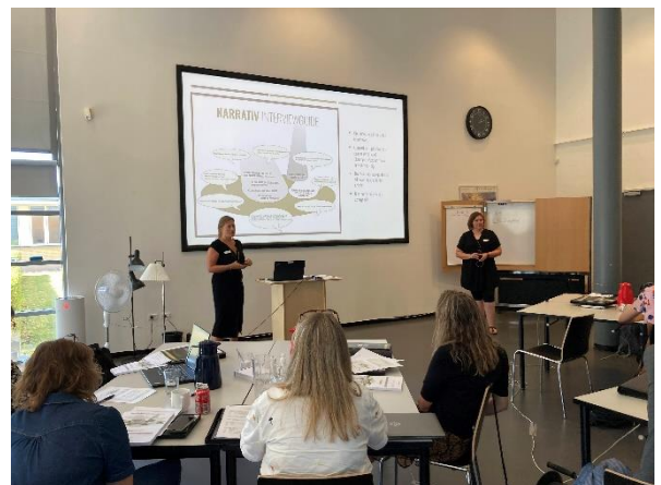
Interviewguiden gennemgås og afprøves med øvelser